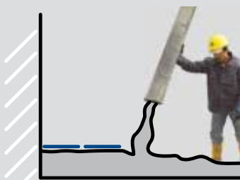
εξομάλυνση δαπέδου σε μια στρώση

Σε σχέση με τα εργοταξιακά παραγόμενα υλικά,διατηρεί καθαρό το εργοτάξιο,δίχως απώλειες υλικών και δημιουργία σκόνης.